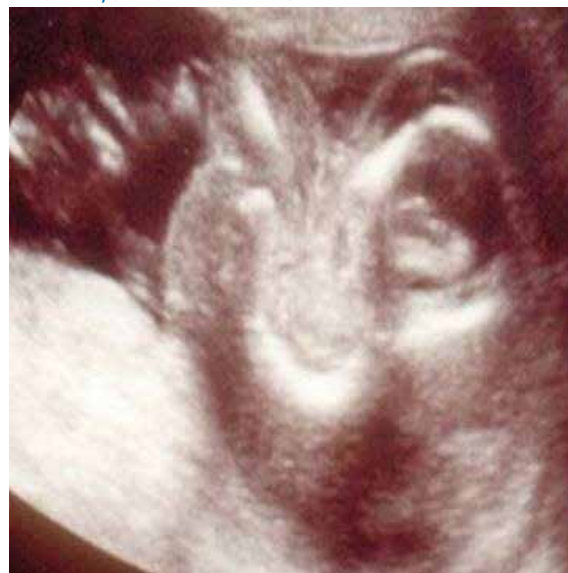
FIGURA 1. IMAGEN ECOGRÁFICA DE GEMELO ACÁRDICO A LAS 12 SEMANAS. SE OBSERVA TÓRAX Y MIEMBROS RUDIMENTARIOS E HIDROPS ABDOMINAL, SIN ACTIVIDAD CARDIACA.

El uso de ecografía Doppler color y tridimensional permitió establecer los vasos que salían y llegaban del gemelo acárdico. Se encontró anastomosis arterio-arteriales en el lecho placentario entre ambos gemelos con el gemelo acárdico mostrando flujo reverso en la arteria y vena um-