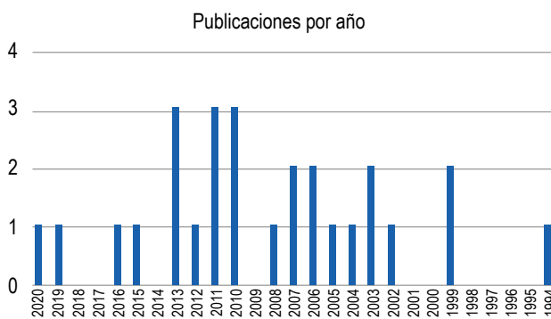
Figura 1. Número de publicaciones de prevalencia de SII por año.

Para Roma II el país con mayor prevalencia fue Venezuela (59%) y el con menor prevalencia fue